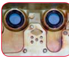
ОРИГИНАЛЬНОЕ МАСЛО HONDA